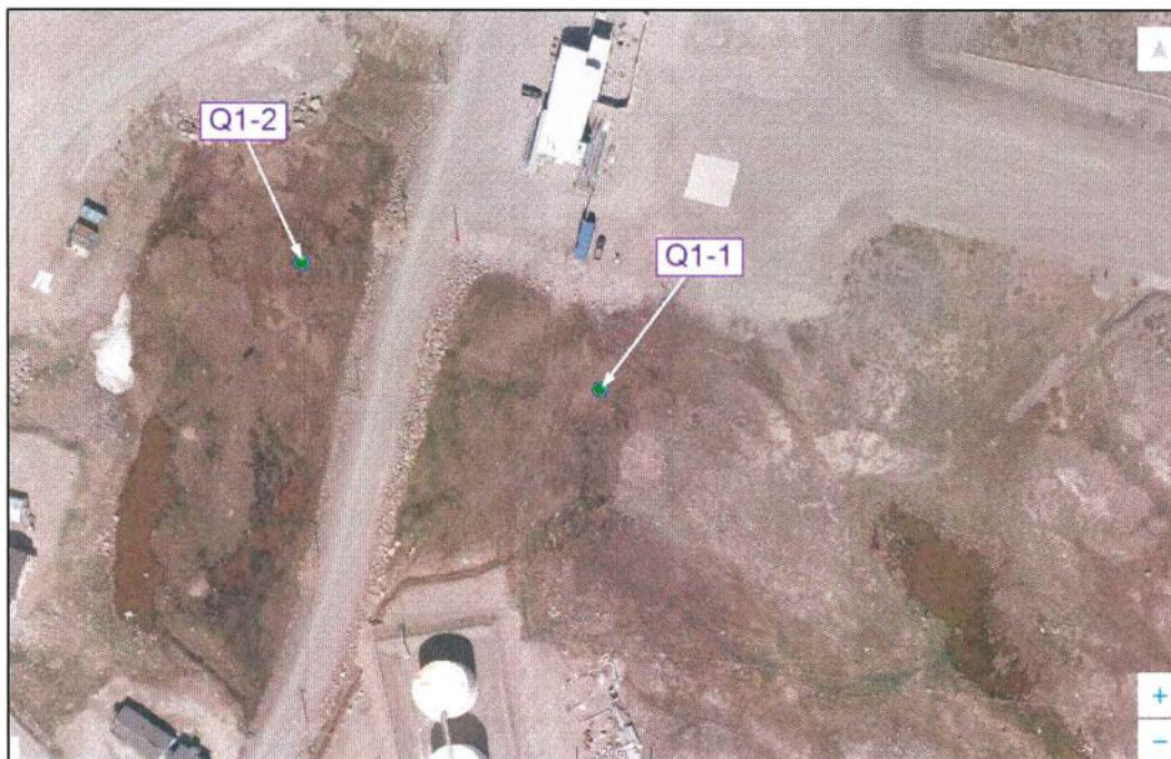
Figure 1 : Emplacement des points d'inventaires écologiques Q1-1 et Q1-2 à l'aéroport de Quaqaq.

Une caractérisation des milieux humides situés autour de l'aéroport de Quaqaq a été réalisée le 17 août 2022. Cette caractérisation complète celle effectuée en 2018 par la firme Poly-Géo inc. (# Dossier MTMDET 7205-18-QH01, N/Réf. 18077). Deux points d'inventaires écologiques ont été positionnés dans des secteurs représentatifs des milieux et situés sur les côtés ouest et est de la route, respectivement. La localisation des points d'inventaires est illustrée sur la Figure 1.