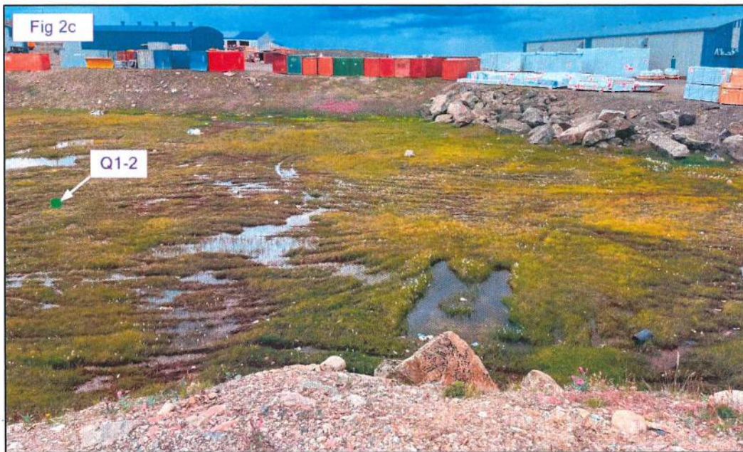
Figure 2 : (2a) Point Q1-1 (marais) et son milieu environnant sur le côté est de la route de l'aéroport. (2b) Secteur au sud du point Q1-2 (côté ouest de la route). (2c) Point Q1-2 et son milieu environnant (marais).