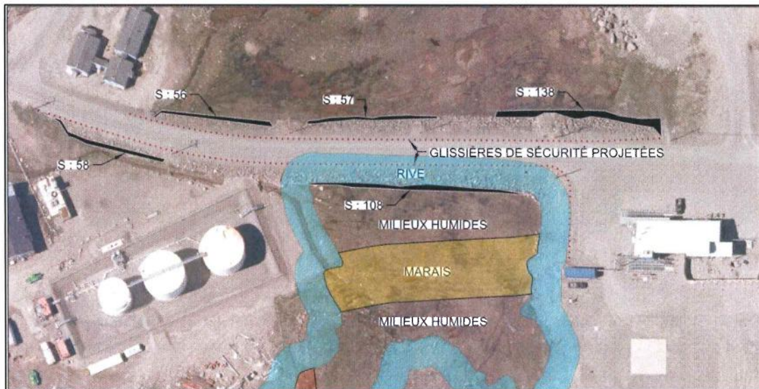
Figure 4 : Superficie estimée d'empiètement de la route sur les milieux environnants de l'aéroport de Quaqtq. Les chiffres (56, 57, 138, 108) correspondent à la superficie des zones en m 2 .

La figure 4 présente l'estimation de la superficie (m 2 ) permanente d'empiètement dans le marais situé près de l'aéroport. Les superficies d'empiètement dans les marais situés sur les côtés ouest et est de la route sont de 251m 2 et 108 m 2 , respectivement.