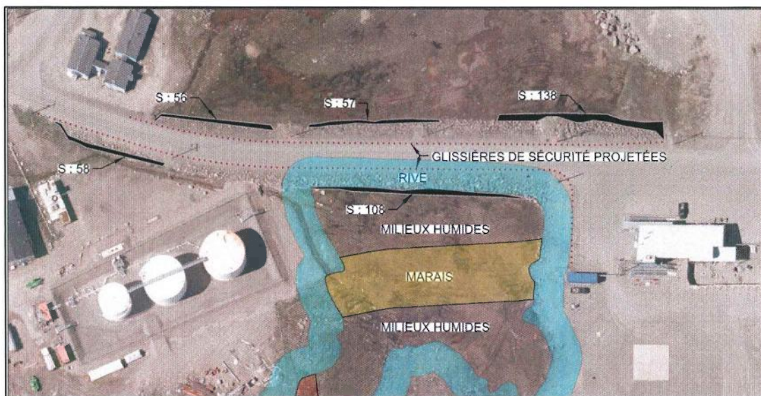
Figure 4 : Superficie estimée d'empiètement de la route sur les milieux environnants de l'aéroport de Quaqaq. Les chiffres (56, 57, 138, 108) correspondent à la superficie des zones en m 2 .

La figure 4 présente l'estimation de la superficie (m 2 ) permanente d'empiètement dans le marais situé près de l'aéroport. Les superficies d'empiètement dans les marais situés sur les côtés ouest et est de la route sont de 251m 2 et 108 m 2 , respectivement.