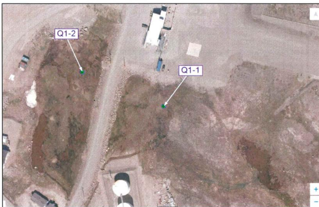
Figure 1 : Emplacement des points d'inventaires écologiques Q1-1 et Q1-2 à l'aéroport de Quaqtaq.

Une caractérisation des milieux humides situés autour de l'aéroport de Quaqtaq a été réalisée le 17 août 2022. Cette caractérisation complète celle effectuée en 2018 par la firme Poly-Géo inc. (# Dossier MTMDET 7205-18-QH01, N/Réf. 18077). Deux points d'inventaires écologiques ont été positionnés dans des secteurs représentatifs des milieux et situés sur les côtés ouest et est de la route, respectivement. La localisation des points d'inventaires est illustrée sur la Figure 1.