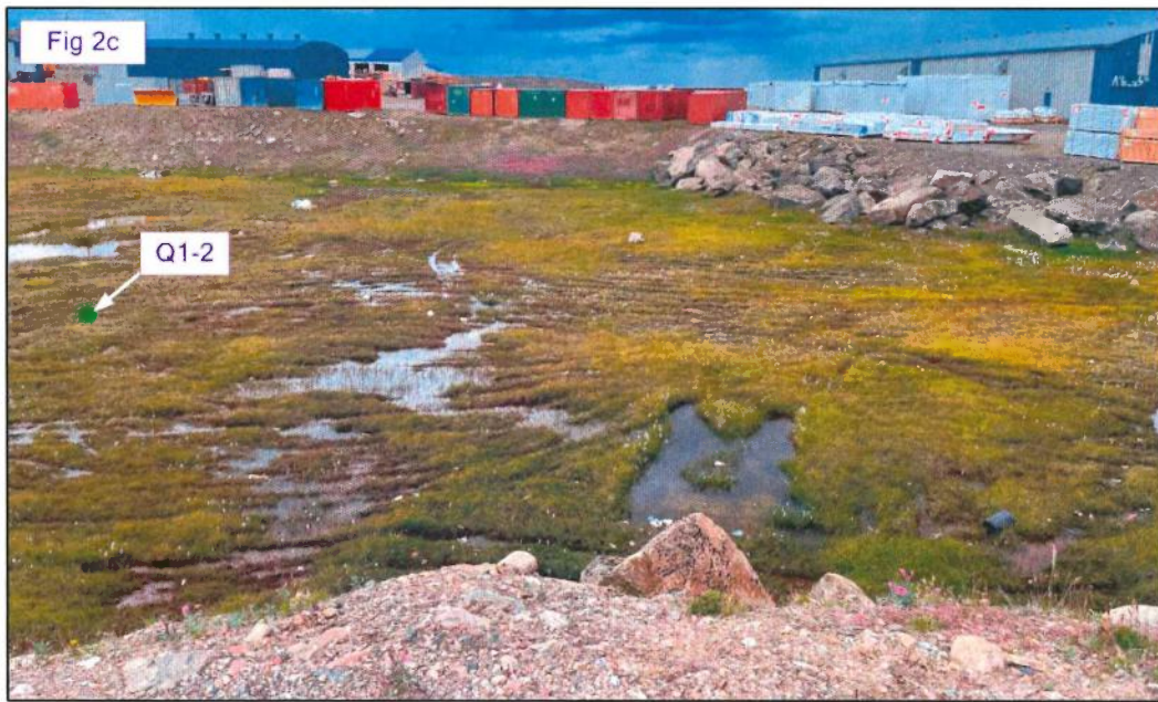
Figure 2 : (2a) Point Q1-1 (marais) et son milieu environnant sur le côté est de la route de l'aéroport. (2b) Secteur au sud du point Q1-2 (côté ouest de la route). (2c) Point Q1-2 et son milieu environnant (marais).